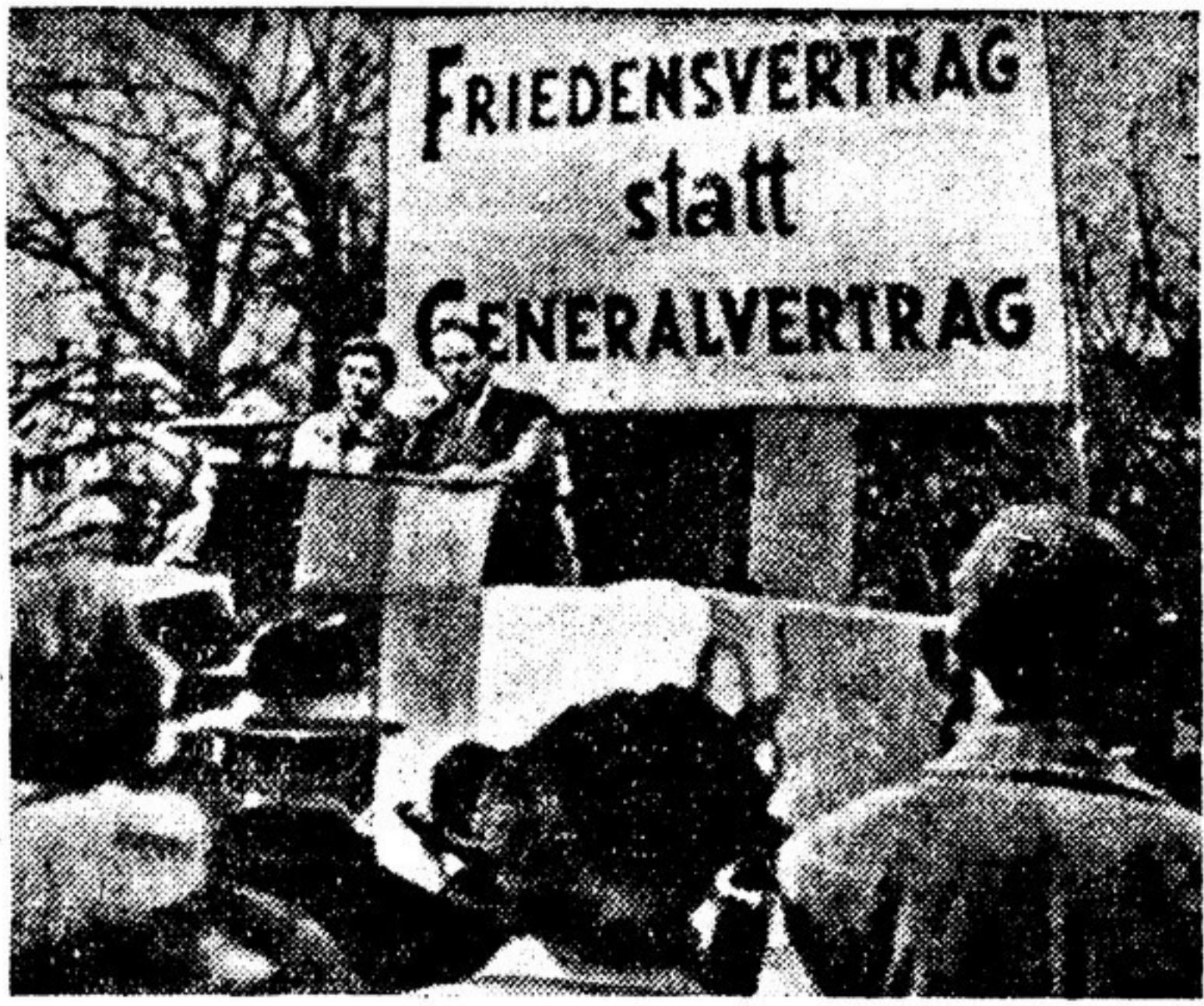
Боннская клика реваншистов во главе с Аденауэром подписала так называемый «общий договор» с тремя западными державами вопреки воле подавляющего большинства германского народа. Население Западной Германии на митингах и демонстрациях, которые проходят повсюду, требует заключения мирного договора, а не «общего договора», создания единой, демократической и миролюбивой Германии. НА ФОТО — митинг сторонников единства Германии в Штутгарте: на плакате — надпись: «Мирный договор вместо общего договора».