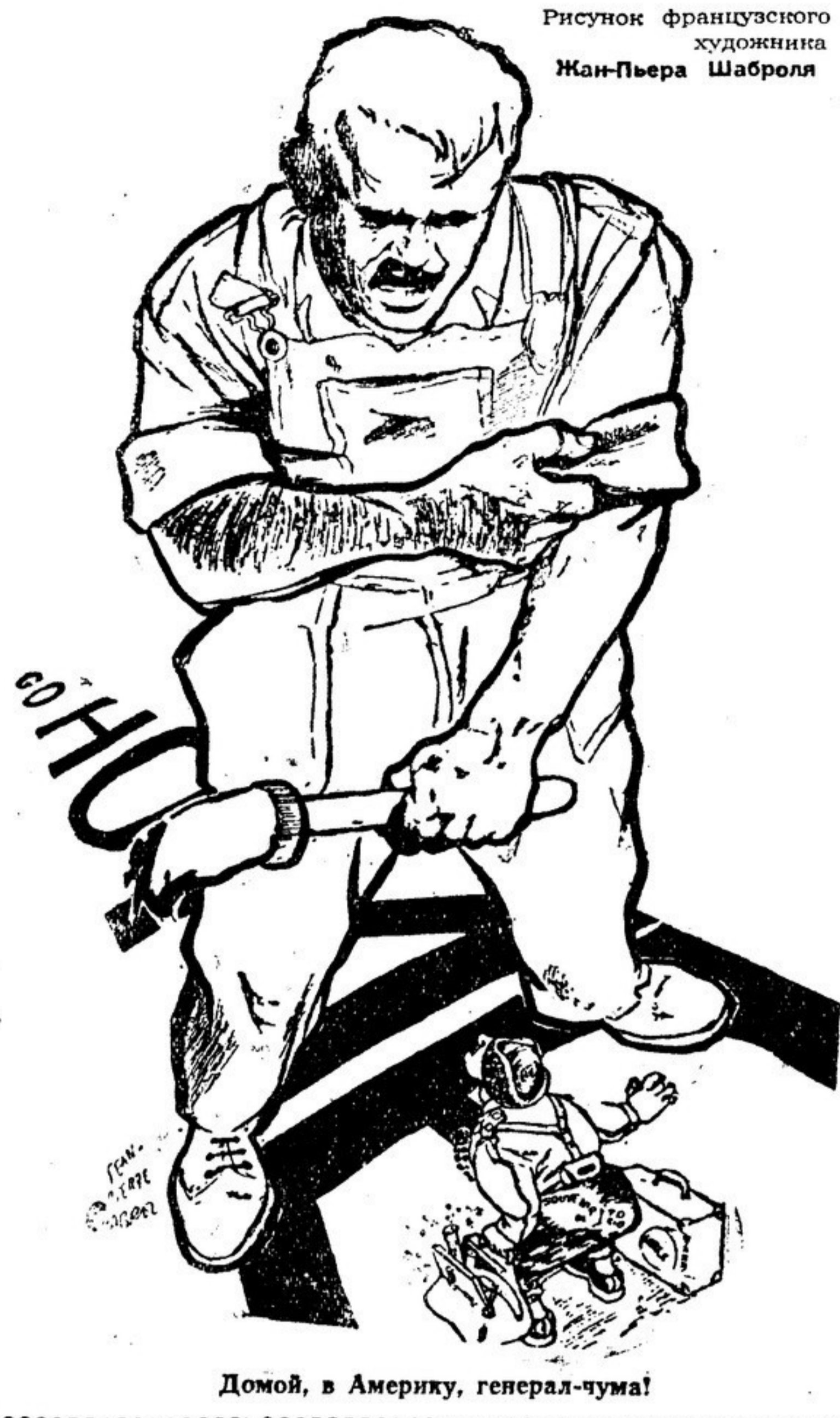
Домой, в Америку, генерал-чума!

Как ни стараются холопы — Пинэ, шуманы и бидо, — Не превратить ему Европы В кровавый лагерь Кочжедо!